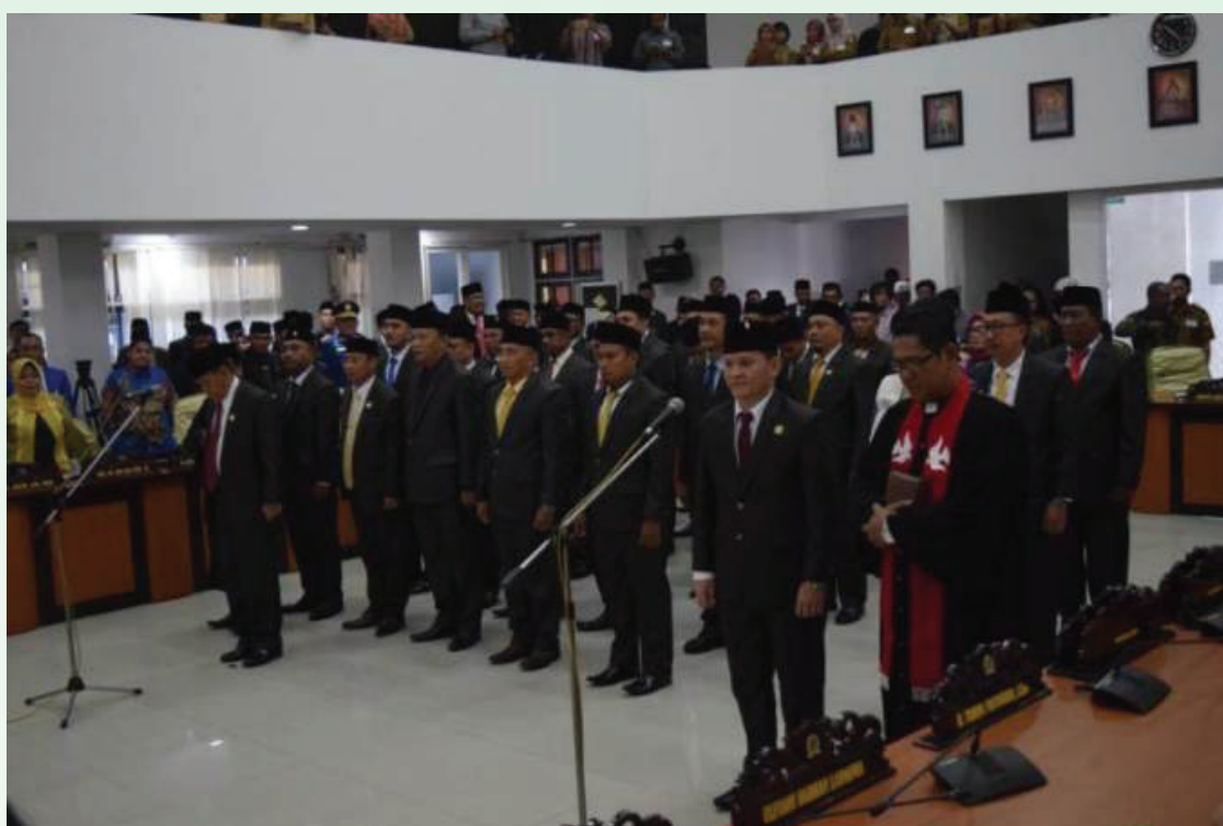
Pelantikan Anggota DPRD Kota Palu 2019 - 2024

Sumber: Sekretariat DPRD Kota Palu dan Data diolah, 2022